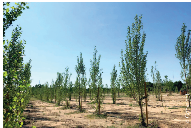
Parque Lineal del Manzanares, Madrid