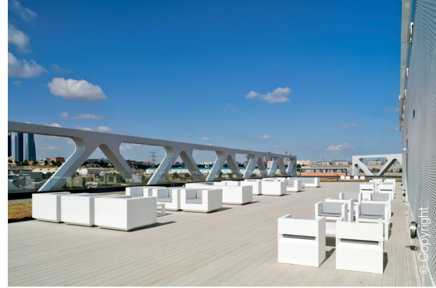
Las Tablas, Madrid

El uso de un material de acabado de cubierta con un elevado valor de reflectancia solar, reporta beneficios no solamente en el comportamiento energético del propio inmueble, sino que contribuye también a reducir el “efecto isla de calor”, tan acusado en la capital.