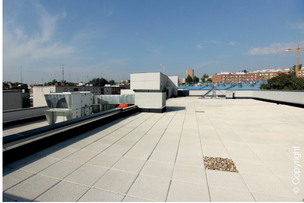
Calle Matapozuelos, Madrid