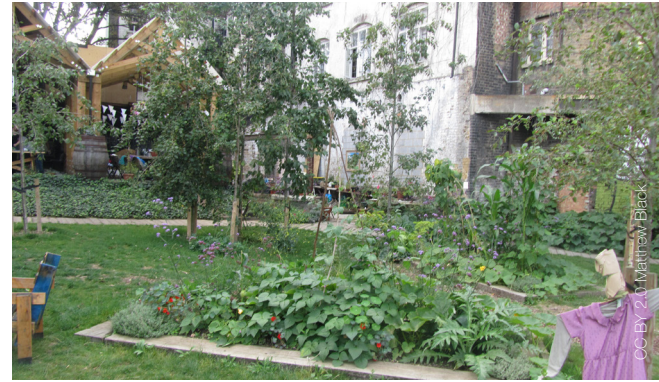
Londres, Reino Unido