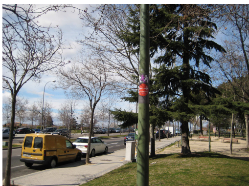
C/ Casalarreina, 28 F-1