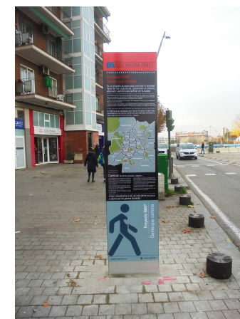
PS 1 Reverso