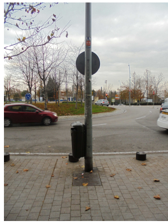
Avda. Portugal, 155C F-1