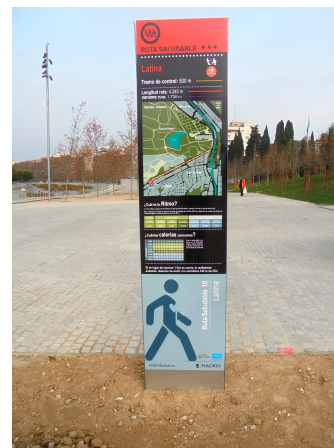
PS 2 Anverso