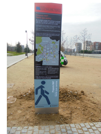
PS 2 Reverso